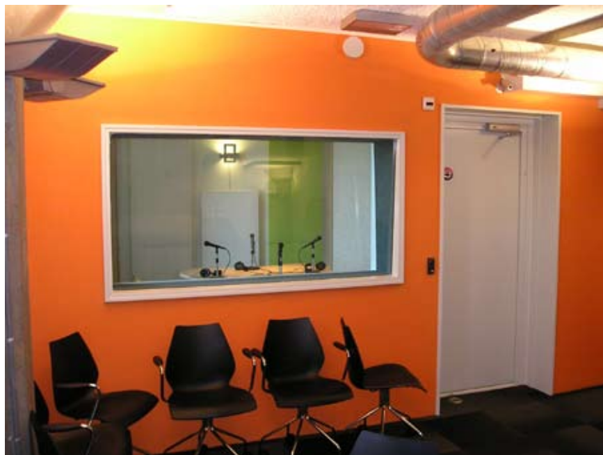
MN 47 Studio de Zwijger Amsterdam