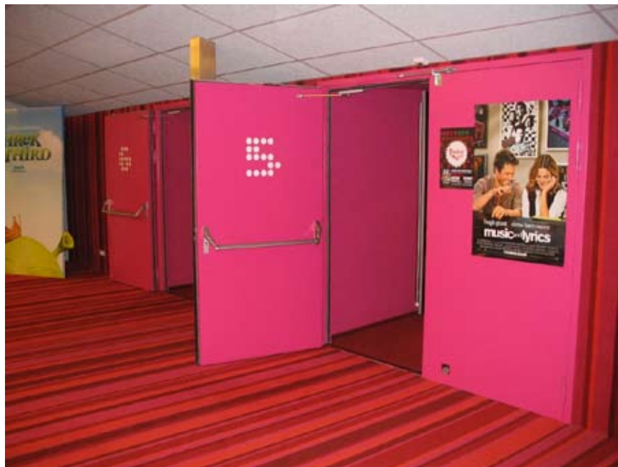
MN 53 Bioscoop Must See Groningen